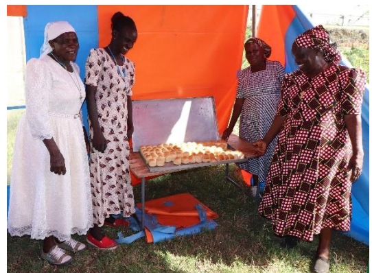
Broodjes voor de verkoop

West leerde Oost hoe ze beter broodjes konden bakken en daar veel meer mee konden verdienen.