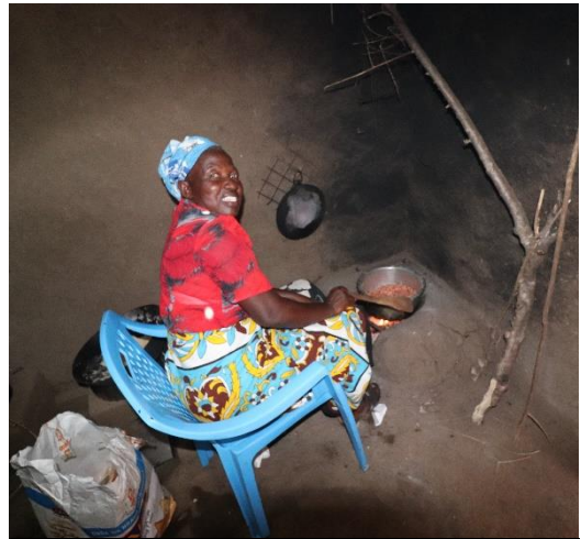
Eten klaarmaken in een hoek van de hut

We kregen filmpjes hoe ze door het water waadden. We maakten ons zorgen omdat er bezichtiging werd verwacht diezelfde week. Tot onze verbazing kwam het bericht dat de bezichtiging zonder problemen was verlopen. Ze hadden alles tijdig droog en schoon gekregen! Ook dat is Kenia, problemen zijn er om op te lossen.