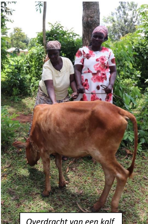
Overdracht van een kalf

De microfinanciering gaat nog steeds door en meestal met (erg) goede resultaten. Ze moeten er soms op gewezen worden, het verdiende, gespaarde geld ook op te maken. In West wordt gespaard voor een bijdrage aan een zeer gewenste tractor!